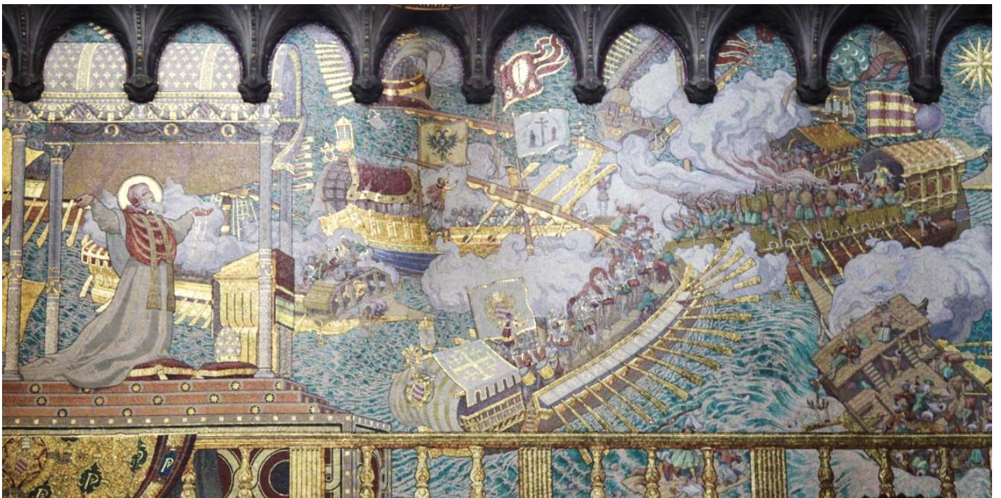
Fresque de la victoire de Lépante, Basilique de Fourvière (Lyon)