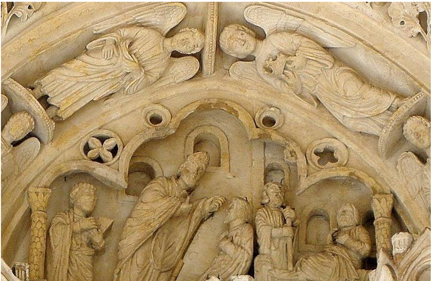
Songes et rencontre de saint Seurin et saint Amand, tympan de la Basilique Saint-Seurin