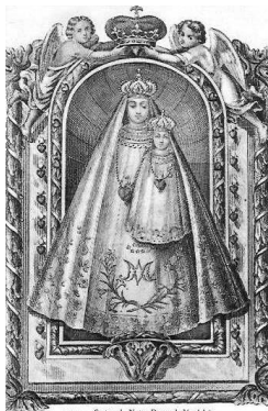
179. — Statue de Notre-Dame de Verdelaï.