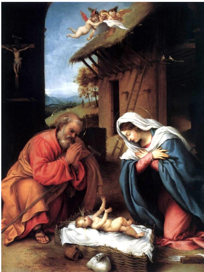
La Nativité, Lorenzo Lotto.