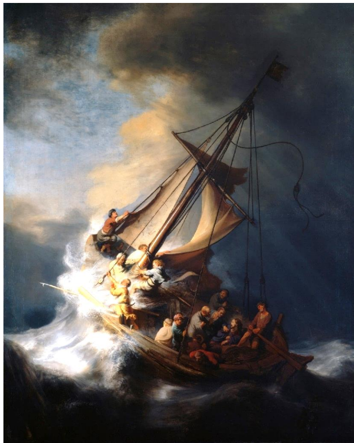
La tempête apaisée, Rembrandt