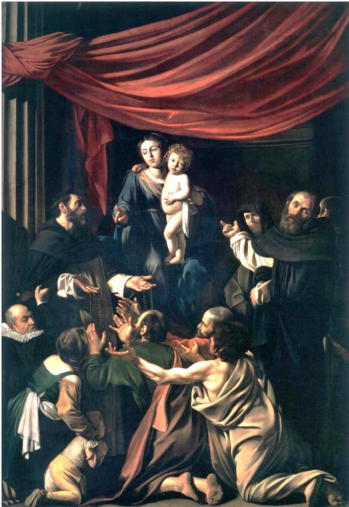
Notre-Dame du Rosaire, Le Caravage

Que les témoignages de l'histoire et les innombrables grâces personnelles obtenues par le Rosaire nous soient un puissant motif de prier pieusement notre chapelet tous les jours.