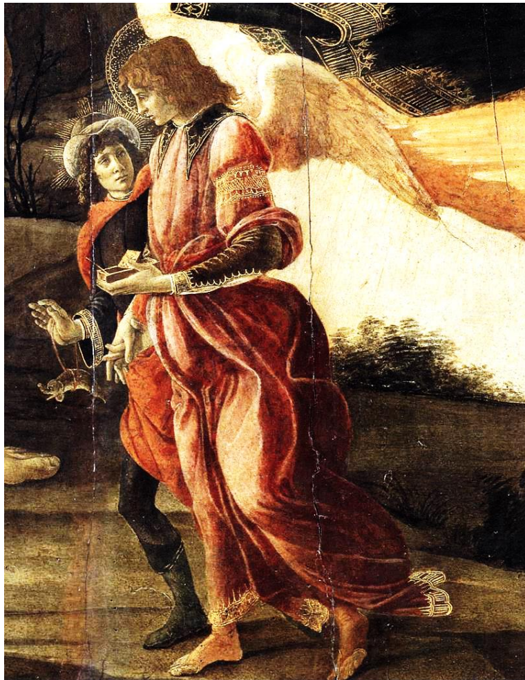
L'ange Raphaël et Tobie, Sandro Botticelli