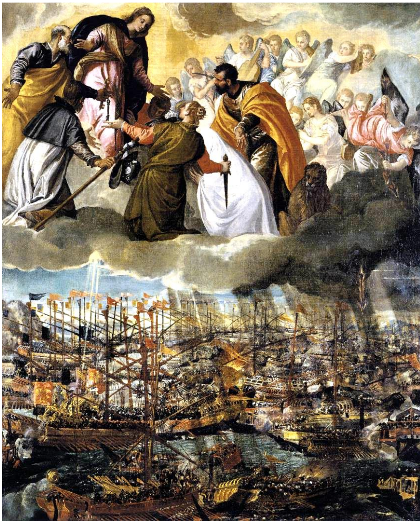
La bataille de Lépante, Paolo Veronese

Il y eut trois grandes batailles contre les musulmans. La première fut une bataille navale qui eut lieu à Lépante le 7 octobre 1571. Le début XVI e siècle avait vu une formidable expansion de l'Islam. Commencée par Soliman II le Magnifique, elle fut poursuivie par son successeur, Selim II. Le danger devint tel que le pape Pie V intervint et réussit à monter une ligue avec Philippe II d'Espagne et la République de Venise. 200 galères, 100 vaisseaux, 50000 hommes (Italiens, Espagnols et Allemands) et 4500 cavaliers furent réunis. Don Juan d'Autriche (24 ans), fils de Charles-Quint et frère de Philippe II, fut désigné comme chef de l'expédition. Il reçut du légat du pape le drapeau de la ligue qui portait d'un côté le Christ en croix, de l'autre les armes du pape, de l'Espagne et de Venise. Le pape fit distribuer un chapelet à chaque soldat, et durant les trois jours précédant l'appareillage, tous se confessèrent et communiaient. Le 14 août 1571,